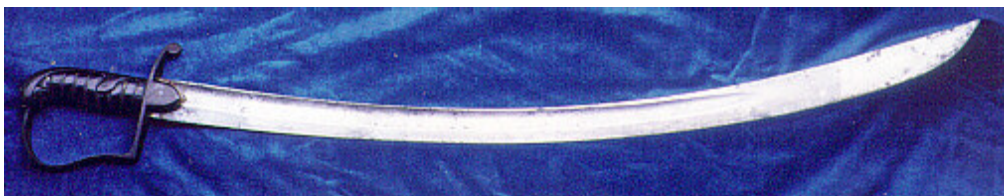
Sable inglés modelo 1796