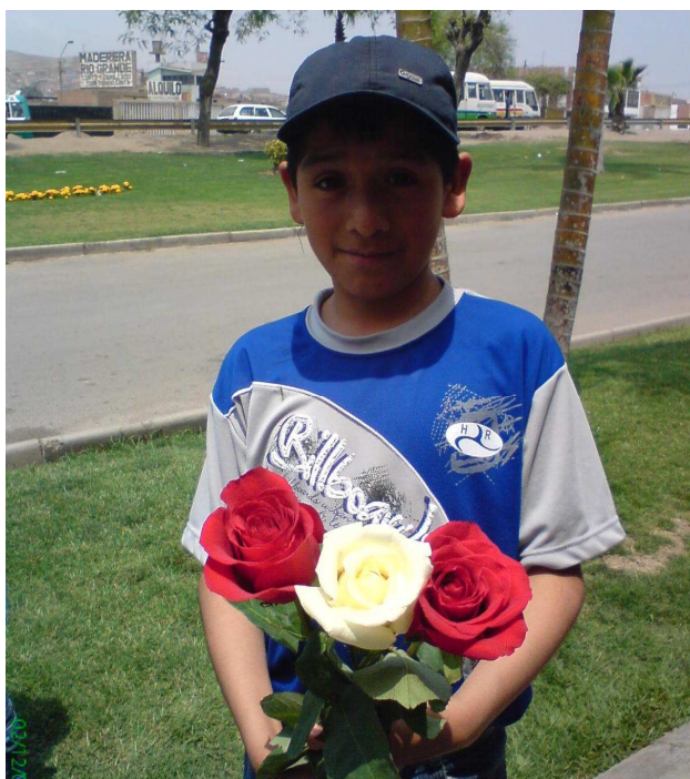
Siempre atento y adelante!!!

Nuestra mejor admiración merecen aquellos que con el sudor de sus mentes hacen de su vida un hábitat de la gloria. Ellos se can-