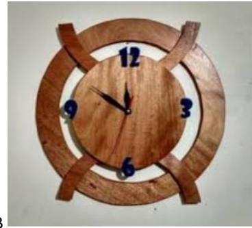
Gambar 11.4. Karya Seni kriya