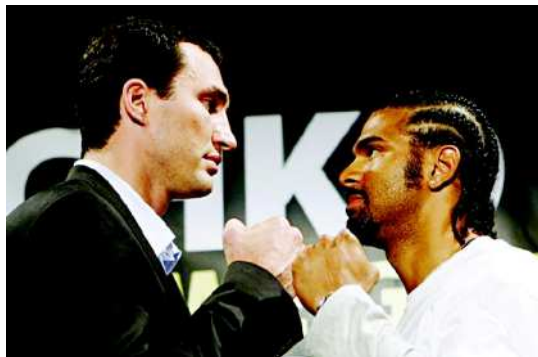
Wladimir Klitschko dan David Haye

Petinju Ukraina Wladimir Klitschko bertekad mengawinkan empat gelar saat menghadapi David Haye, Juni atau Juli mendatang. Yang diincar: kelas berat versi IBF dan WBO miliknya, ditambah gelar IBO dan WBA milik Haye