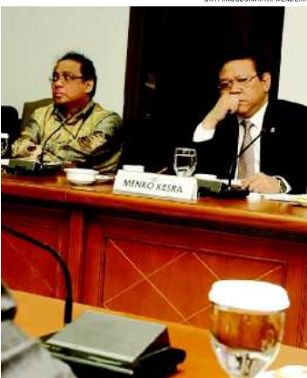
PEGANG BIBIR: Menteri Koordinator Kesejahteraan Rakyat, Agung Laksono saat mendengarkan keterangan sejumlah perwakilan tokoh agama dalam acara focus discussion group tentang konflik agama di Kemenko Kesra, Jakarta Pusat, kemarin.