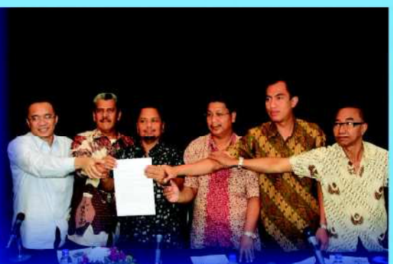
Forum Pemilik Suara PSSI (FPSP)

5. Jika tak terjadi kesepakatan dalam kongres, keputusan terakhir diserahkan ke FIFA