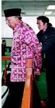
MELANGKAH: Bekas Menteri Sosial Bachtiar Chamsyah saat menjalani sidang lanjutan di Pengadilan Tipikor, Jakarta, kemarin.

"Selama terdakwa menjadi Menteri Sosial, banyak bencana alam maupun bencana sosial yang terjadi, sehingga menjadikan terdakwa sangat sibuk luar biasa. Kemungkinan inilah faktor yang menjadi pemicu, ketika terdakwa tidak hati-hati dalam menetapkan kebijakan. Ketidakhati-hatian ini tentu juga karena pembawaan sifat terdakwa yang senantiasa berhadapan dengan kejadian kedururutan yang membuat terdakwa ha-